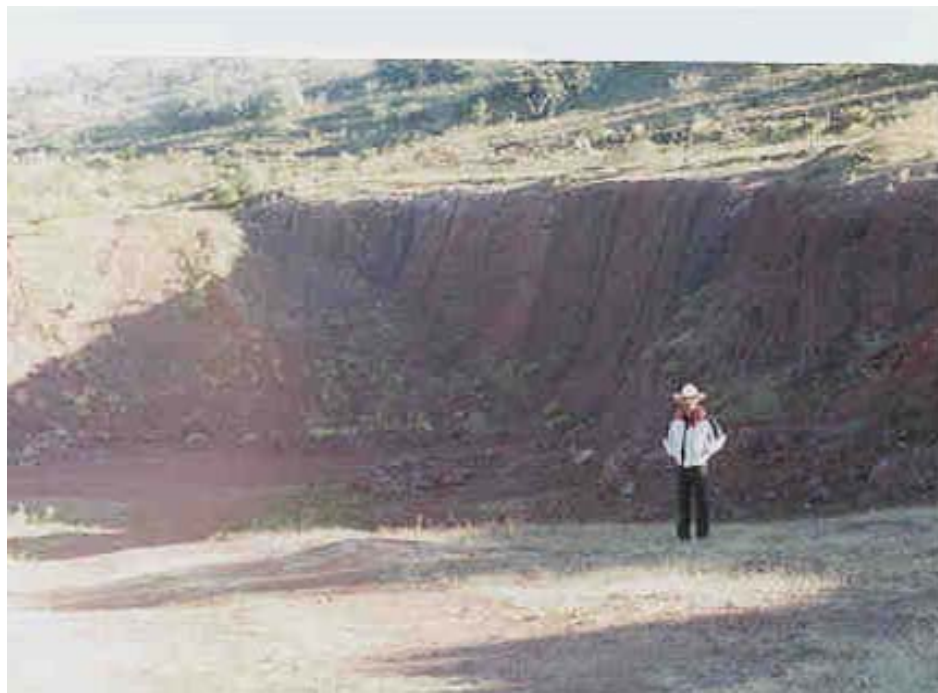
FOTOGRAFÍA No. 5. YACIMIENTO DE ESCORIA VOLCÁNICA EN LA LOCALIDAD DE “HUAPANGO”, MUNICIPIO DE TARIMORO, GTO.