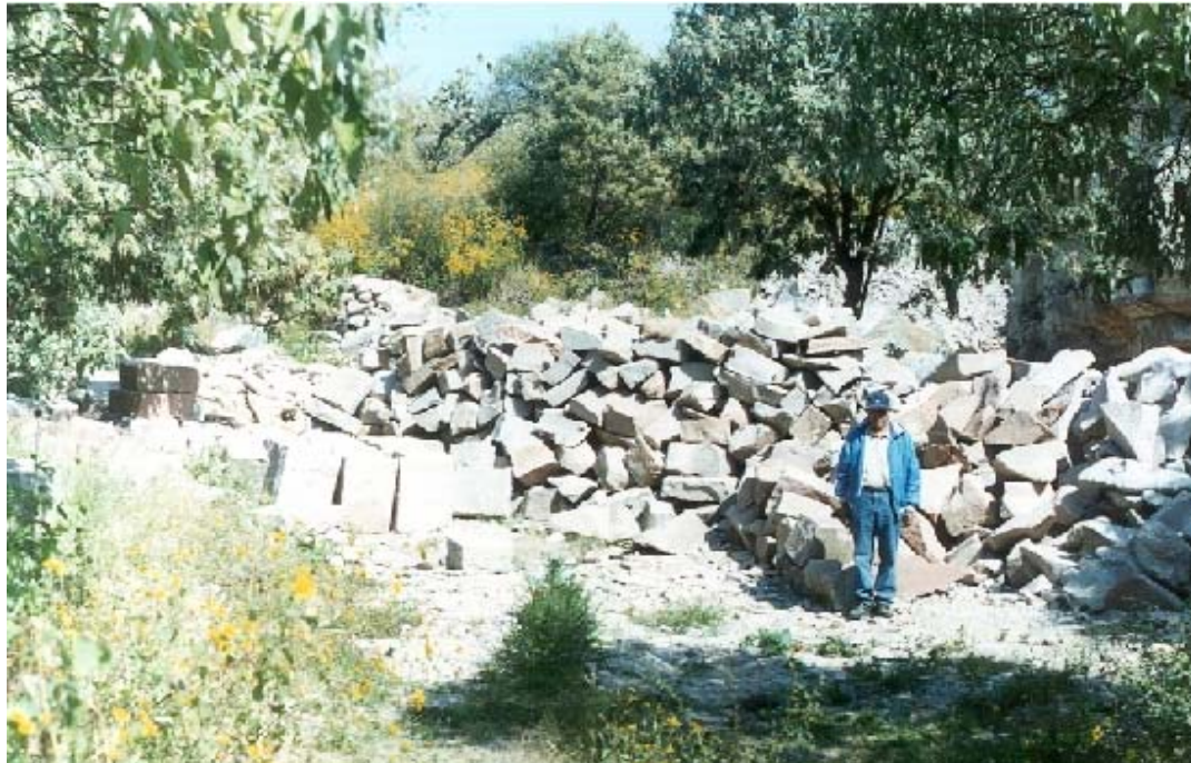
FOTOGRAFÍA No. 8. BLOQUES DE CANTERA LISTOS PARA SU VENTA LO CALIDAD “HUAPANGO”, MUNICIPIO DE TARIMORO, GTO.