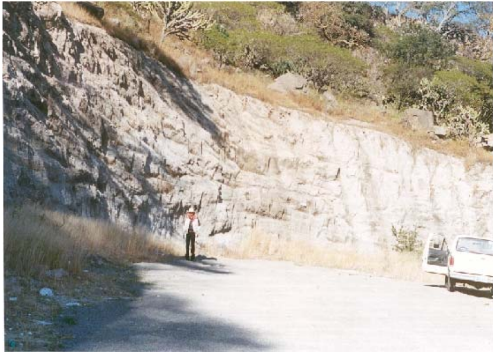
FOTOGRAFÍA No. 3. COLADA DE BASALTO EN LA LOCALIDAD “LOS MEZQUITES”, MUNICIPIO DE TARIMORO, GTO.