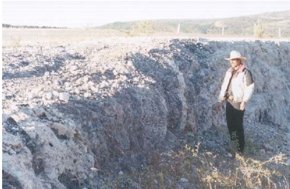
FOTOGRAFÍA No. 10. FLORAMIENTO DE OBSIDIANA EN LA LOCALIDAD “LA CAÑADA”, MUNICIPIO DE TARIMORO,