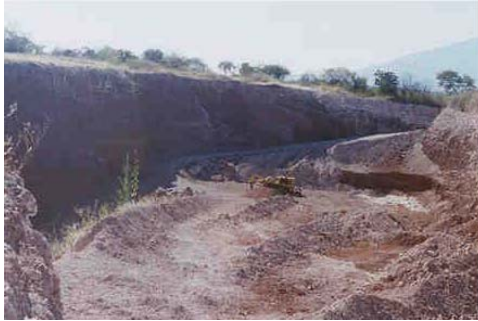
FOTOGRAFÍA No. 1. YACIMIENTO DE ESCORIA VOLCÁNICA EN LA LOCALIDAD “LA ESPERANZA”, MUNICIPIO DE TARIMORO, GTO.