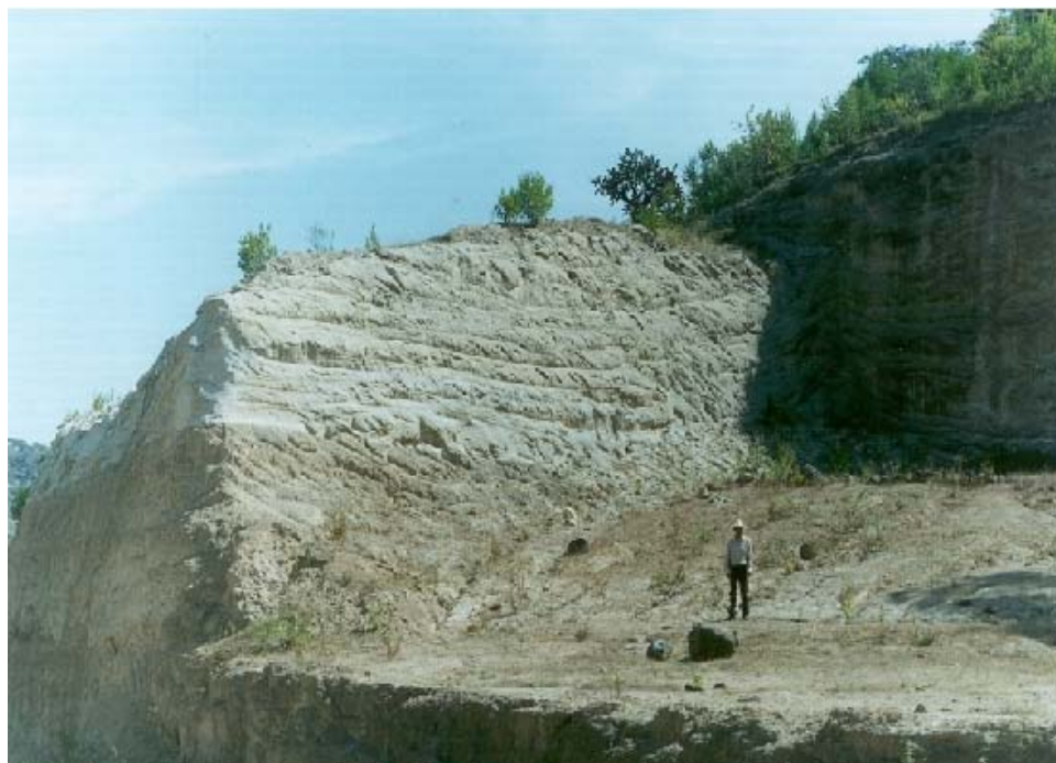
FOTOGRAFÍA No. 4. COLADA DE BASALTO EN LA LOCALIDAD “LOS MEZQUITES”, MUNICIPIO DE TARIMORO, GTO.