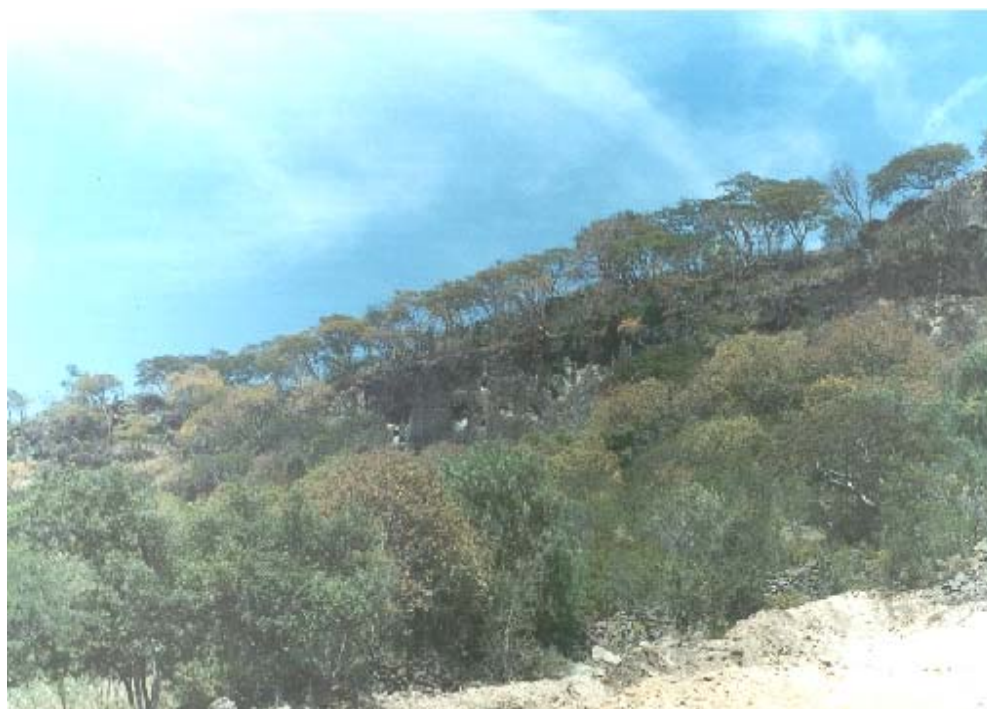
FOTOGRAFÍA No. 6. COLADA DE BASALTO EN LA LOCALIDAD “LA CAÑADA”, MUNICIPIO DE TARIMORO, GTO.