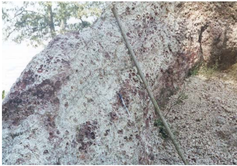
FOTOGRAFÍA No. 9. HUECOS ORIGINADOS POR EL ESCAPE DE GAS PROCESO DE ENFRIAMIENTO DE LAS RIOLITAS DONDE SE FORMAN LOS ÓPALOS, ACEBUCHA, MUNICIPIO DE TARIMORO, GTO.