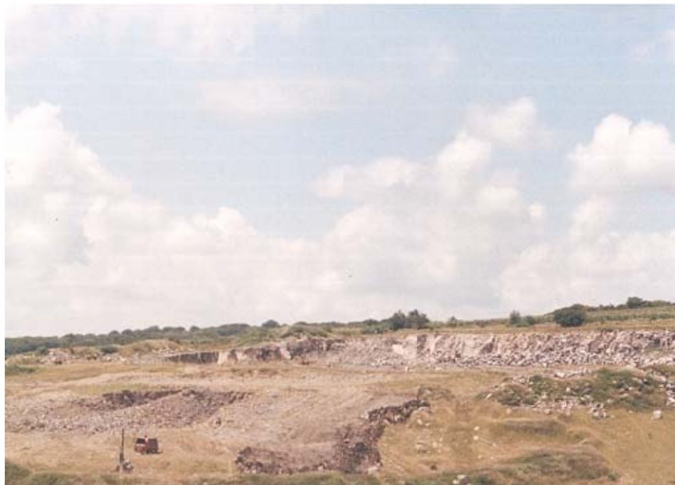
FOTOGRAFÍA No. 5. COLADA DE BASALTO EN LA LOCALIDAD “LOS MEZQUITES”, MUNICIPIO DE TARIMORO, GTO.