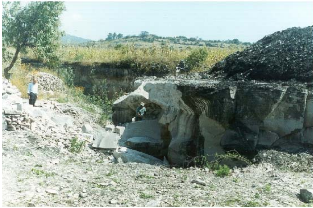
FOTOGRAFÍA No. 7. BANCO DE EXPLOTACIÓN DE CANTERA EN LA LOCALIDAD “HUAPANGO”, MUNICIPIO DE TARIMORO, GTO.